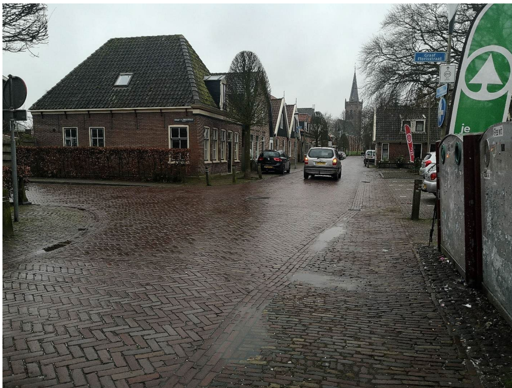
Kruising Burgemeester Hoogenboomlaan - Graaf Florisstraat

Hoofdvraag: Hoe worden de aspecten verkeersveiligheid, verkeershinder, verkeersdoorstroming en verblijfskwaliteit beleefd door fietsers en voetgangers op de onderzoek locatie?