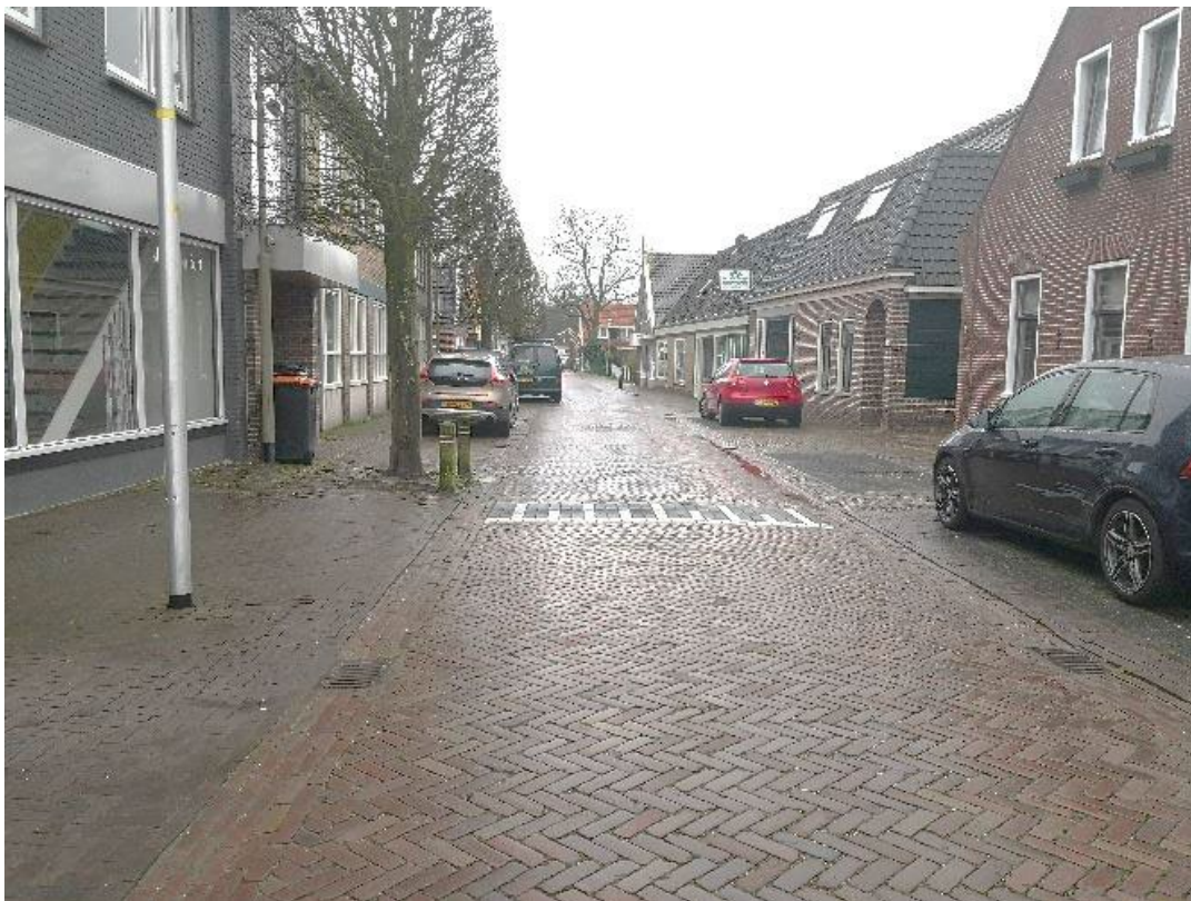
– Burgemeester Hoogenboomlaan, vanaf de Herenweg

Doordat het gehele wegvak een gelijke hoogte heeft, lijkt het voetpad weg te vallen.